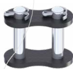
Maglia di giunzione a copiglia RIF : 008