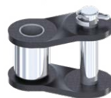
Falsa maglia semplice a copiglia RIF : 016