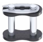
Maglia di giunzione a molletta RIF : 006