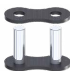
Maglia esterna da ribadire RIF : 005